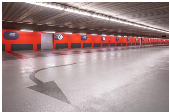
Onze referentie in Arnhem (Nederland): Parkeergarage Arnhem Centraal