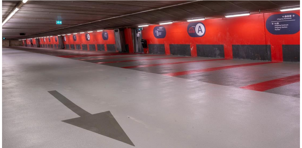
Onze referentie in Arnhem (Nederland): Parkeergarage Arnhem Centraal